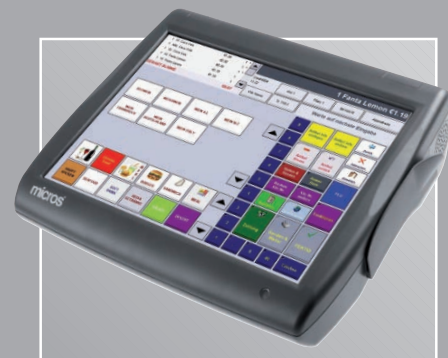
MICROS e7 als Desktop-Version