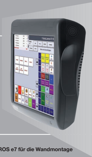
MICROS e7 für die Wandmontage