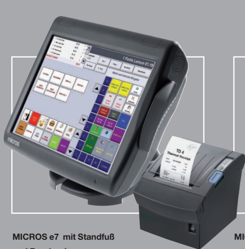
MICROS e7 mit Standfuß und Bondrucker